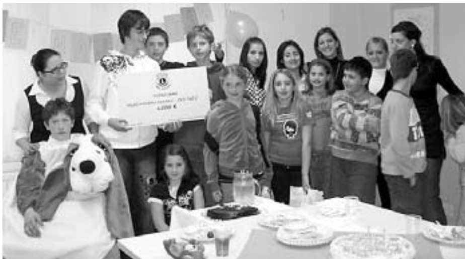
Mladi se že veselijo počitnic.

Prisrčna hvala Lions Klubu. Njihovo plemenito dejanje ne bo pozabljeno. Hvala tudi vsem ostalim donatorjem, ki zvesto in nesebično pomagajo naši otroški mladini vse leto, in sicer: Picerija Bit, Metro trgovska družba, d. d., Tržič, Adriatic Slovenica Kranj, Hipermarket Spar Tržič, Picerija Bazenček Tržič, Bistro Školjki Tržič, Brodar, s. p., Tržič, Orehek, d. o. o., Tržič, Trgovina Dona Tržič, Slaščičarstvo Cerkovnik Tržič, Mikona, d. o. o., Tržič, Trgovina Romi Tržič, Abit, d. o. o., Križe, Kalipso, d. o. o., Križe, Luen, d. o. o., Pristava, Mobitel Telekomunikacijske Storitve, d. d., Ljubljana, Optika Saša, Tržič, Okrepčevalnica In Pekarna Tržič, Slaščičarna Pajaziti, Tim-Pro, d. o. o., Naklo, Interalp, d. o. o., Križe, Sava, d. d., Kranj, Lekarna Deteljica, Tržič, Merkur, d. d., Naklo, Melom, d. o. o., Tržič, Trafika Tržič, Kavarna Špela Tržič, Frizerski Salon Ziblerka Tržič, Cestno podjetje Kranj.