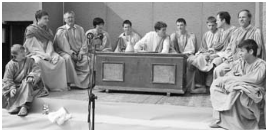
Uprizoritev dogodkov na veliki četrtek