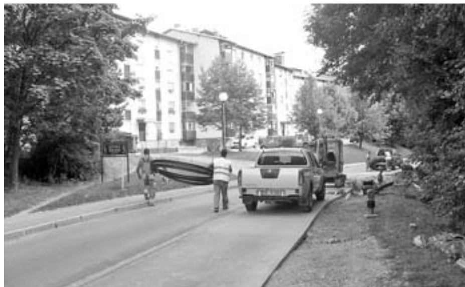
Dela na Kovorski cesti so zaključena.