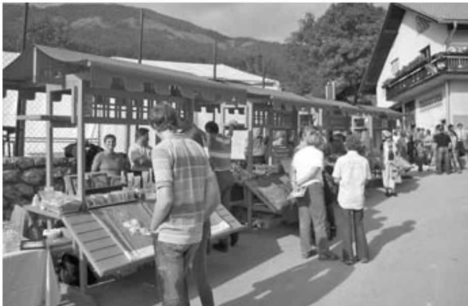
V Lešah so na ta poseben dan postavili tudi vrsto stojnic.