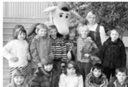
Srečanje s Pasavčkom

Projekt je bil zaključen z odmevno prireditvijo 27. marca 2009 v šoli Bistrica in Križe, kjer so otroci sodelovali pri pravilnem pripenjanju v avto sedežih ter se tehtali na naletnih tehtnicah, kjer jim je bilo razloženo, s kakšno težo ob morebitnem trku avtomobila lahko priletijo v sopotnika pred njim. Najbolj nestrpno pa so pričakovali srečanje z maskoto Pasavček, s katero so navdušeno zaplesali in mu zapeli, seveda pa ni šlo brez veselega fotografiranja.