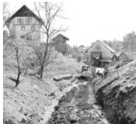
Gradbena dela v Grabnu so že stekla.

Druga faza del se bo začela izvajati v letu 2010, zgradila se bo spodnja dovozna cesta vključno z asfaltirano navezavo na obstoječo cesto in zadrževalnik meteorne vode nad obstoječo cesto. Stanje na območju je zaradi neurejenega odvajanja odplak in močnega smradu že desetletja nevzdržno, zato se nam zdi pomembno, da se z ureditvijo kanalizacije prebivalcem v tem delu Kovorja omogoči dostojno življenje.