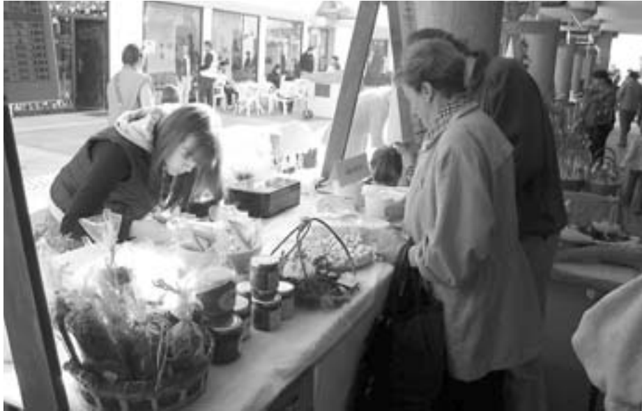
Prodaja na stojnici Biotehniškega centra Naklo

V soboto, 11. aprila, je bilo v atriju Občine Tržič zelo živahno. Na stojnicah so lahko obiskovalci izbirali med gojenimi alpskimi trajnicami, čebelarskimi izdelki, lonci za rože, zeliščnimi mazili, dekorativnimi izdelki iz različnih materialov za dom in vrt, oblačili in obutvijo za vrtničarje, na stojnici Biotehniškega centra Naklo se je dalo kupiti tudi poleg semen in drugega programa iz njihove ponudbe tudi mlevske izdelke in pecivo iz njihove šolske proizvodnje, njihova dijakinja pa