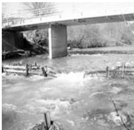
Prag mostu pri Padarju je močno poškodovan.

vzročajo vremenske nevšečnosti, poskušamo čim prej odpraviti. S pravočasnim ukrepanjem prispevamo k zmanjševanju stroškov sanacij, ki se z odlašanjem samo povečujejo, s tem pa zagotavljamo uporabnost infrastrukture v splošno zadovoljstvo.