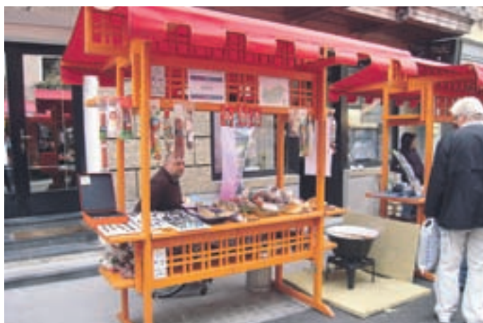
Stojnica madžarskega partnerskega mesta Dabas