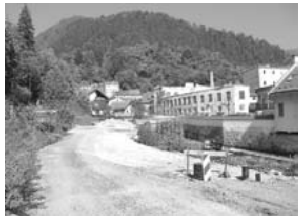
Za Mošenikom bodo kmalu na voljo nova parkirišča

čistilne naprave, prenova "Placa", kočna na Zelenici, prenova cest, vodovodov ... Županstvo ni služba, je poslanstvo, da kar največ narediš ljudi iz naše mesto!