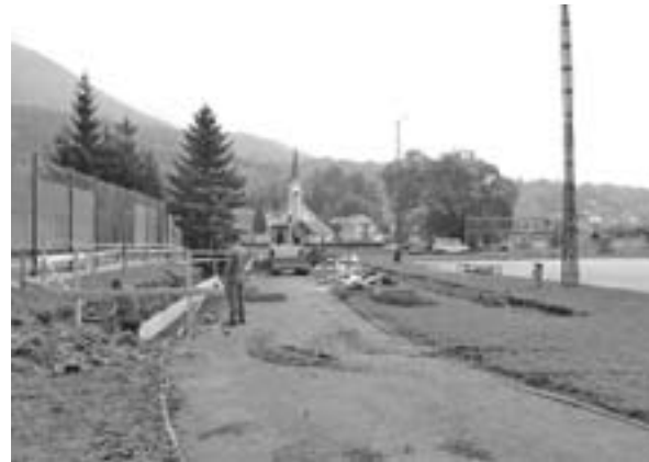
V Križah raste sodobni atletski in skate park

Po gospodinjstvih je v predvolilnem času zaokrožila revija z naslovom Novi Trzičan. Oblikujejo ga predstavniki za odnose z javnostmi enega izmed mojih protikandidatov. Sam se z demantiji takih dezinformacij, žalitev in neresnic ne mislim ukvarjati. O meni govorijo dejanja: izvedli smo več kot 150 projektov, počrpali 12,7 milijona evrov evropskega denarja, kar je največ med gorenjskimi občinami, v Trziču smo premaknili zadeve, ki so stale desetletja - izgradnja