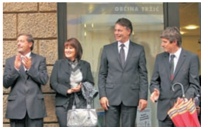
Živahno odprtje so popestrili konjeniki, posebni gostje, prijatelji iz pobratenega Zaječarja in koncert Modrijanov.