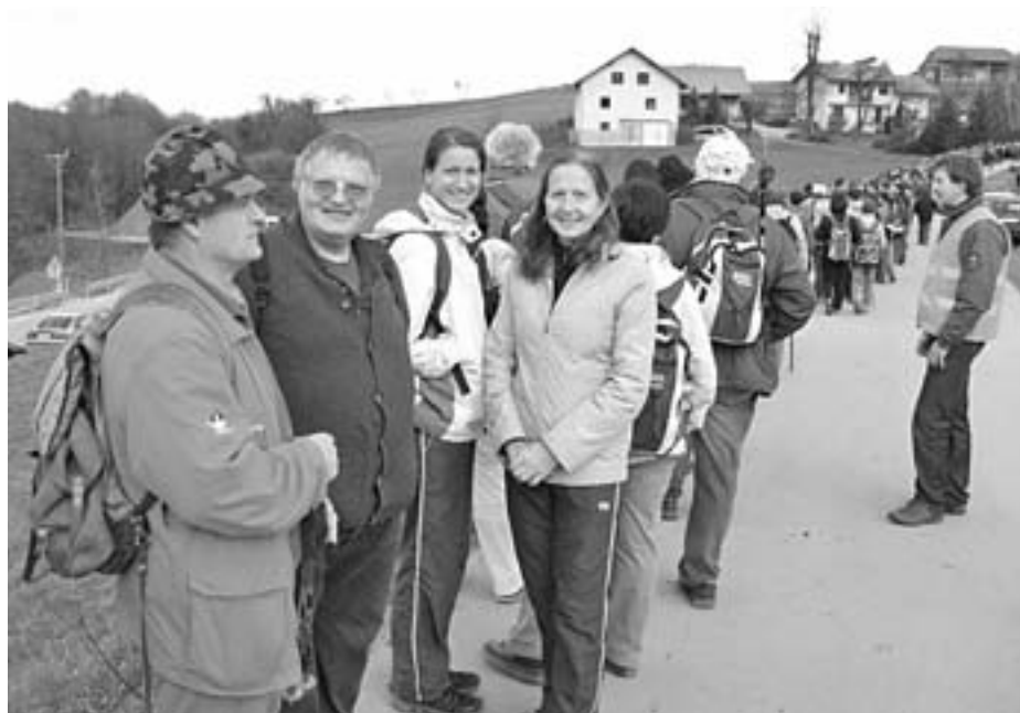
Na Pohodu od Litije do Čateža

V soboto, 13. novembra, pa je kar 8-članska ekipa odšla na Pohod od Litije do Čateža. To je kar 21 km dolga pot in od pohodnikov zahteva kar veliko telesno pripravljenost. Ta dan pa smo se udeležili tudi republiške proslave ob tem prazniku v Kočevju. Vsi pa smo se v nedeljo zbrali pred društveno pisarno in odšli na dopoldanski pohod proti Gostišču SMUK, kjer smo z dejavnostmi zaključili. Pri vseh pohodih nas je spremljalo lepo vreme in z veseljem ugotavljamo, da nas je vsako leto več.