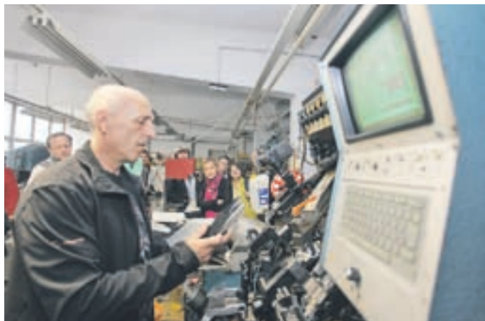
Tovarna Peko je vsako uro odprla vrata obiskovalcem