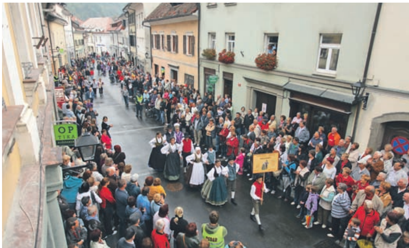
Staro mestno jedro naj z novo podobo spet postane mesto nakupov, zabave in druženja