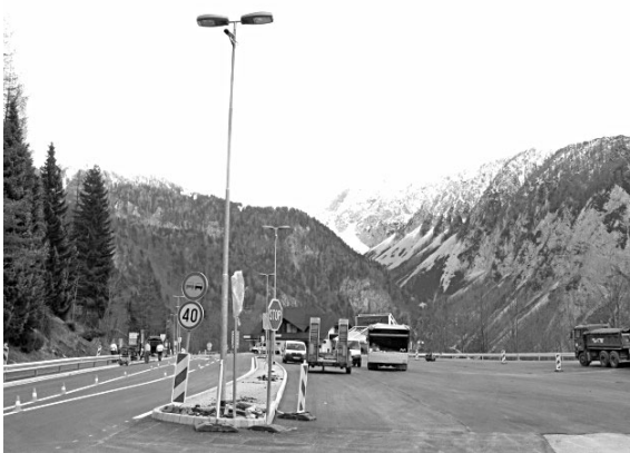
Nova vrata v Slovenijo

Po dolgih desetletjih obljub je naposled stekla gradnja pločnika Kovor-Zvirče. Dejanja, ne besede! Odsek je bil zaradi precejšnje gostote prometa nevaren za številne pešce in sprehajalce, izgradnja pa je bila tudi moje predvolilno zagotovilo vsem krajanom KS Kovor. Gradnja poteka malo počasneje zaradi nekaterih zemljiško-knjižnih problemov, ampak kot kaže jih bomo uspešno rešili, česar si vsi zelo želimo. Načrtujemo tudi že pločnik v spodnjem delu naselja Zvirče in pločnik proti Loki. Nisem pa pozabil na pločnik skozi Snakovo, in upam, da bomo tudi tam čim prej začeli s težko pričakovano izgradnjo.