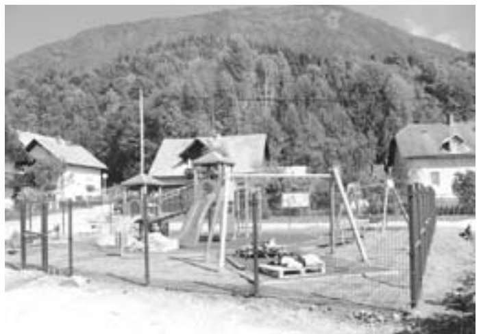
Igrišče v Pristavi