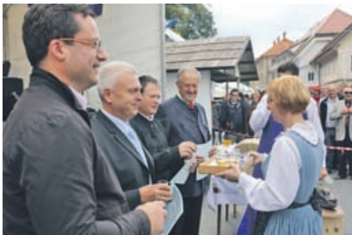
Gostje so bili sprejeti med čevljar'ske pomočnike