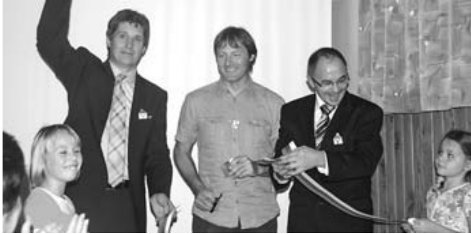
Odprtje igrišča v Lomu

Starši in otroci v Lomu so dolgo časa čakali na dograditev športnega igrišča pred osnovno šolo. Šola namreč nima urejenega ustreznega športnega igrišča, kjer bi lahko potekale ure športne vzgoje, prav tako v Lomu ni igrišča, ki bi otrokom omogočalo popoldanske športne dejavnosti, igre z žogo in družabne igre.