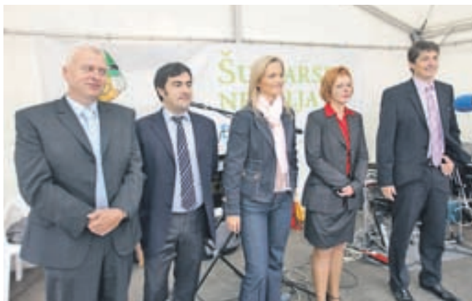
Predstavniki organizatorjev z ministrice