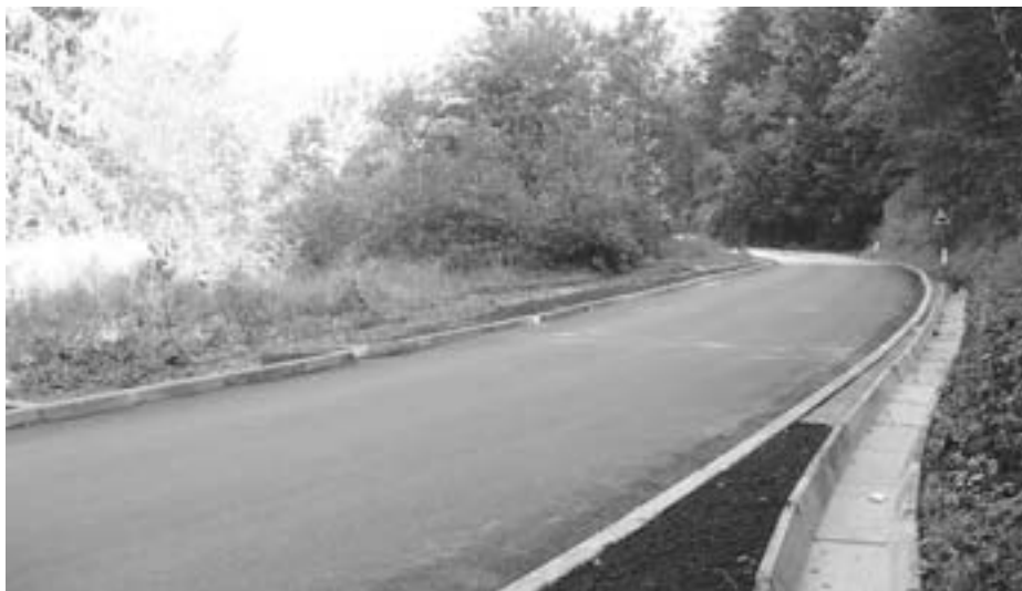
Sanirani usadi pri Gabercu v Dolini

Čeprav je naša krajevna skupnost po številu prebivalcev med najmanjšimi v občini, s takšnimi in podobnimi investicijami skrbimo za njeno dobro povezanost s Tržičem in zagotavljamo njen skladen razvoj. Ves mandat smo z županom dobro sodelovali, za kar se mu iskreno zahvaljujem, kot najpomembnejši dosežek pa poleg zgoraj naštetih lahko izpostavim še prenovo središča vasi Jelendol in organizacijo številnih prireditev (MINFOS, Tek po Dovžanovi soteski, športne tekme ...).