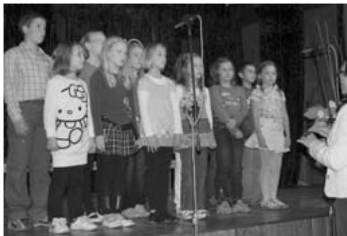
Učenci POŠ Lom so nas z igro, pesmijo in plesom popeljali skozi pomembnejša obdobja v zgodovini lomske šole.