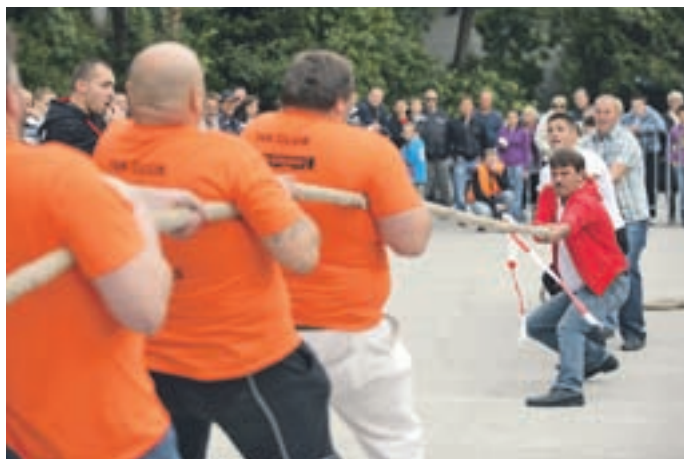
Tekmovalce za najmočnejšega šuštarja so ogrevali obiskovalci