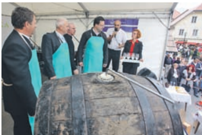
Pred odpiranjem sodčka brezplačnega piva