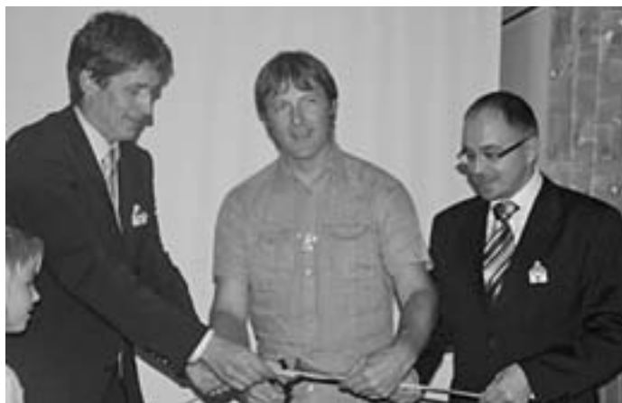
Simbolično odprtje igrišča - trak so prerezali župan Občine Tržič, predsednik KS Lom pod Storžičem in ravnatelj OŠ Tržič.