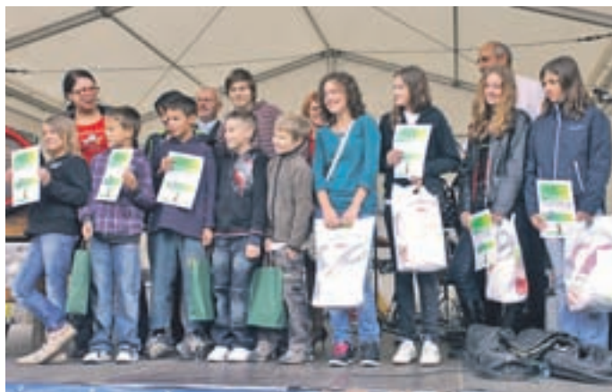
Nagrajenci natečaja Ustvari svoj lastni par