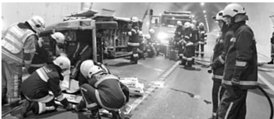
Reševanje ponesrečenca iz prevrnjenega vozila

Za vse sodelujoče gasilce iz GZ Tržič je bila ta vaja zelo pozitivna izkušnja. V preteklosti so bile sicer že organizirane skupne vaje predvsem v predoru Ljubelj, vendar v bistveno manjšem obsegu in zelo redko s hkratnim sodelovanjem avstrijskih in slovenskih gasilcev. Tokrat je bila vaja v predoru načrtovana in izvedena tako, da smo slovenski in avstrijski gasilci ter avstrijski reševalci (Rdeči križ) delali skupaj in drug drugemu po potrebi pomagali. Tako smo naše delo lahko primerjali z delom kolegov iz Avstrije, poleg tega pa smo se še bolj spoznali, predvsem z določenimi vodji gasilskih organizacij onstran meje. Zelo pozitivno za nas je bilo tudi sodelovanje s poklicnimi gasilci iz JZ GRS Kranj, ki imajo pri reševanju v prometnih nesrečah izredno veliko izkušenj.