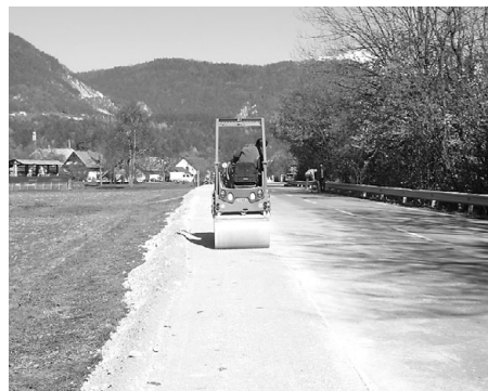
Pločnik Kovor - Zvirče

Nekatera velika slovenska gradbena podjetja so se znašla v velikih finančnih, ki se ne kažejo zgolj v dramatičnih prizorih obubožanih in prezebljih delavcev, ki jih lahko gledamo prek televizije. Številne občine in celo država se srečuje s problemom, da gradbene investicije stojijo, ker gradbeniki zaradi neplačevanja podizvajalcev (npr. predor Markovec) ali pa so projekti zaradi stečajev gradbincev celo ustavili (grad Khislstein v Kranju). V Trziču imamo glede tega veliko srečo, saj nam je z izjemnimi naporji ter stalnimi kontakti s predstavniki SCT-ja uspelo zagotoviti, da se dela niso ustavila nekje na polovici. Občina Trzič ima do vseh, ki so svoje delo opravili kvalitetno in pošteno poravnane vse obveznosti, brez zamud in v zakonitih