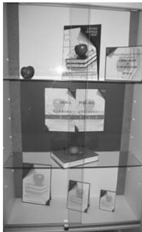
Nova podoba Ljudske univerze Tržič

enakih možnosti za študente s posebnimi potrebami, socialni integraciji manjšincev in migrantov ter zagotavljanju vključevanja mladih in odraslih s posebnimi potrebami na trg dela. Drugi dan je bilo delo v delavnicah namenjeno organizaciji študijskega obiska: pripravi programa, njegovi izvedbi in promociji. Veseli smo, da nam je evropski center CEDEFOP zaupal organizacijo študijskega obiska o vseživljenjskem učenju in aktivnem socialnem vključevanju odraslih in starejših s posebnimi potrebami. To je za nas velik izziv, zato se bomo polni svojih idej lotili priprave študijskega obiska v novembru 2010. K sodelovanju bomo povabili zanimive in kompetentne strokovnjake. Udeležencem bomo predstavili razmere in svoje izkušnje na tem področju, ob tem pa bomo ves čas