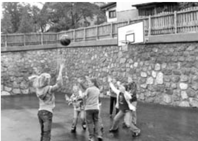
Novo igrišče v Lomu

Nikakor si ne želim zopet blatenja Trziča po vseh nacionalnih medijih in poročanja o tem, kako je to mesto nenehnih prepričkov in afer. Štiri leta sem pazil na ugled mesta, tako bo tudi pred volitvami! Seveda pa bodo "junaki" svoje zlonamerne in netočne trditve morali dokazati pred za to pristojnimi institucijami, saj menim da so šle zadeve kljub predvolilni vročici prek meje normalne in zdrave politične tekme.