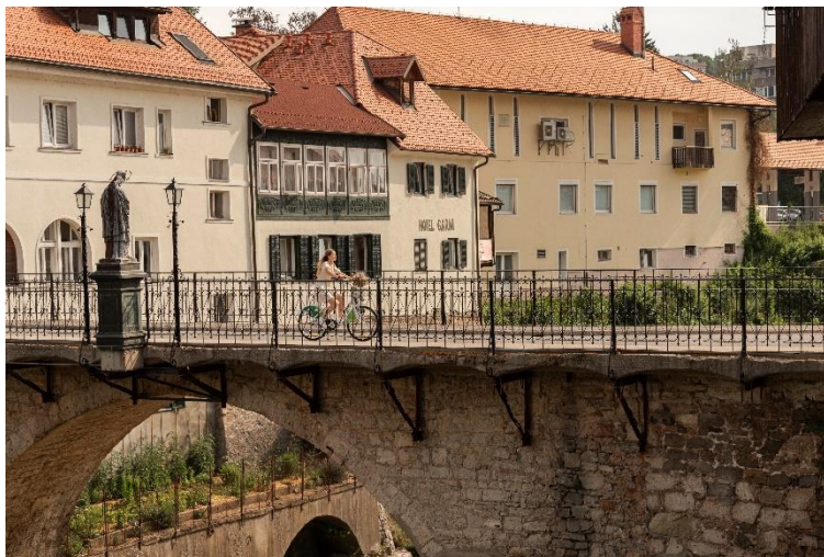
Gorenska.bike v Škofji Loki.

sistem izposoje, s katerim se uporabnik lahko na primer iz Škofje Loka odpravi na delo ali po opravkih v Kranj, tam vrne kolo na eni izmed tamkajšnjih postaj in se domov vrne prav tako na trajnosten način, z vlakom ali avtobusom.