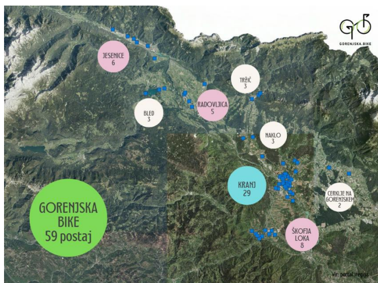
Postaje v sistemu Gorenjska.bike.

V Kranju in Škofji Loki so v zimskih mesecih na voljo le navadna kolesa, v aprilu pa v ponudbo dodajo tudi električna kolesa. Večina občin je v prvih aprilskih dneh sistem že odprla, zadnje občine pa odprtje načrtujejo do 22. aprila, svetovnega dne Zemlje.