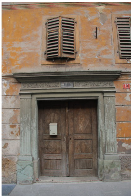
Tržic - Hiša Trg svobode 29 EŠ[...].jpg