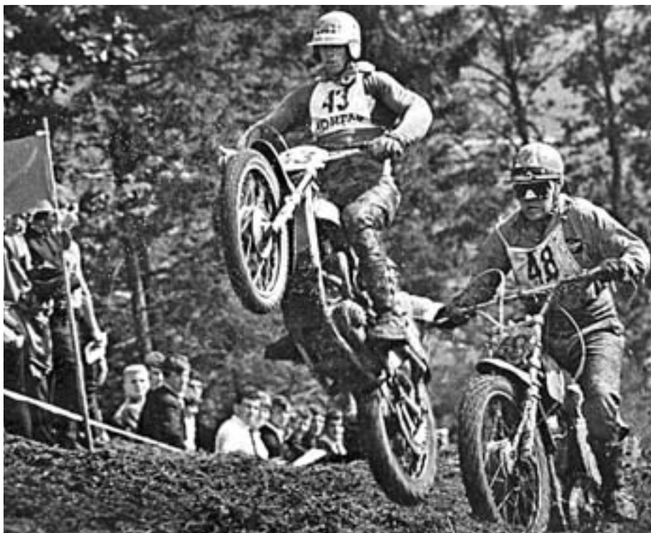
Srdit boj na progi za motokros v Podljubelju

V tem zborniku so obeleženi vsi mejniki pri delu avto-moto društva. Če si predstavljamo, da je vsako leto v organih društva, v prireditvenih odborih in tekmovalci vključeno okrog 200 ljudi, potem je lahko skupna številka kar 12 tisoč. Veliko je bilo narejeno, doseženi so bili vrhunski rezultati, a čas naredi svoje in spomini zbledijo. Vsi zapisi gotovo ne bodo omenjali vseh oseb, ki so pomagale soustvarjati dogodke. Če ima kdo še kakršne koli pomembne zapise ali dopolnitve k posameznimi dejavnostmi, jih lahko zapiše in z dokazili odda v tajništvo AMD Tržič. Namen je bil dober, a če smo koga izpustili, tega nismo storili namerno. Želim vam prijetno branje.