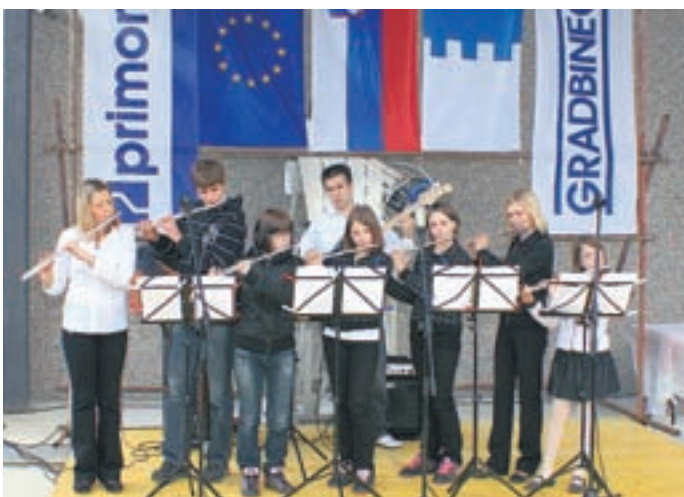
Glasbeniki in plesalci so poskrbeli za pester kulturni program.