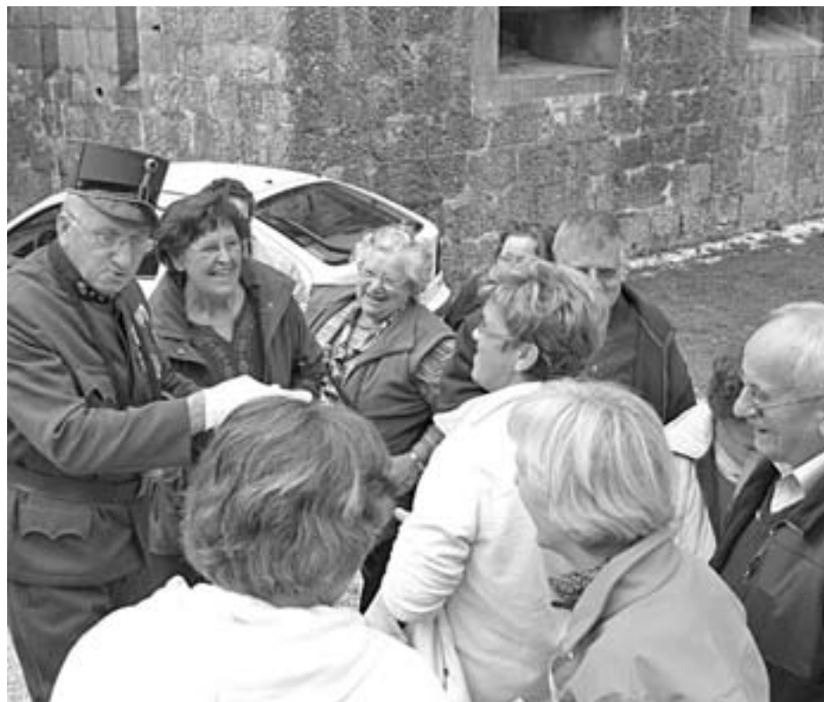
Spoznali smo stroga trdnjavska navodila.

V začetku septembra Društvo diabetikov Tržič vedno izvede ekskurzijo z zanimivo vsebino. Tokrat smo se odpravili na Primorsko in se tako za ta dan poskušali živeti v čas znamenite Soške fronte v času 1. svetovne vojne.