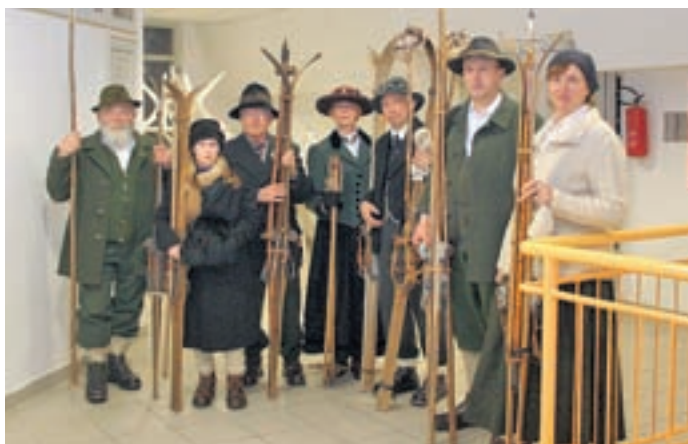
Starosvetni smučarji so popestrili prireditev.