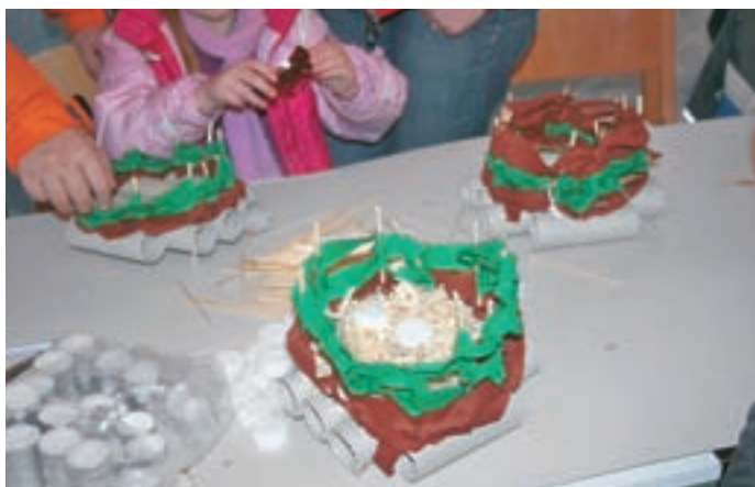
Delavnica "Naredi si svoj camboh"