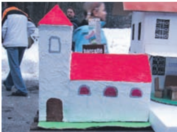
Gregorčka 2010 je izdelal Nik Perko.