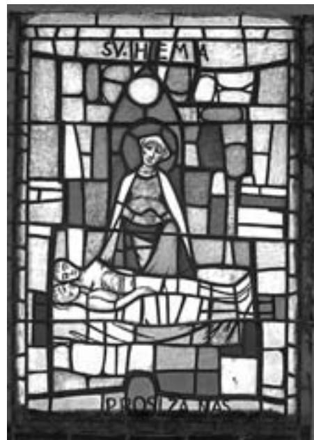
Vitraj sv. Heme v cerkvi sv. Ane na Ljubelju, razstava: Vrtnica v mojem srcu, 2004

V zadnjem času je pri nas poznana in dobro obiskana Hemina pot. S tem projektom je želela katoliška cerkev na Koroškem znova oživiti staro romarsko pot, ki je vodila iz različnih krajev na Krko. Ena izmed poti se začne tudi pri nas, z mašo v cerkvi sv. Ane na Ljubelju in se nadaljuje do Krke. Film Heilige Orte Gurk je film, ki se te na poseben način dotakne, saj v sebi nosi različna sporočila. Smiselno bi ga bilo v prihodnosti opremiti še s slovenskimi podnapisi. V Tržiču in v mu-