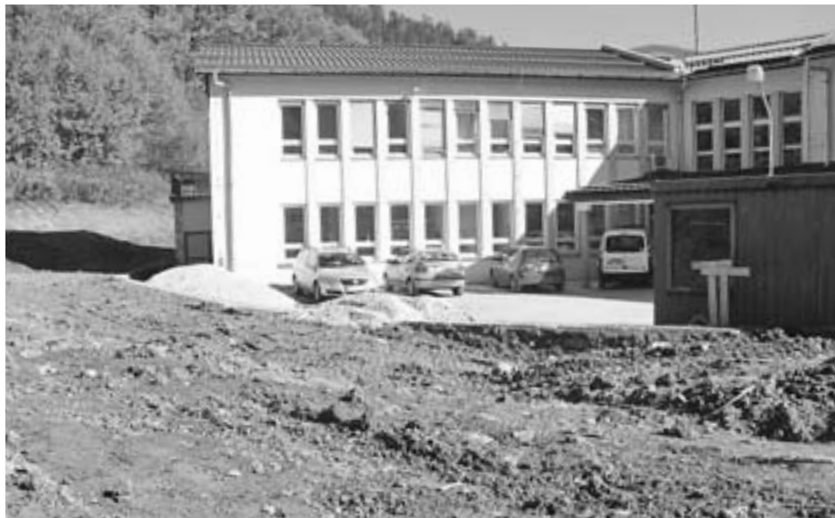
Stekla je gradnja parkirišč pri Zdravstvenem domu Tržič

V sklopu čezmejnega evropskega projekta s sosednjo Avstrijo smo obnovili fasado in uredili okolico tržiške knjižnice. V preteklem letu smo prenovili streho in kotlovnico. Stavba na Balosu 4 ima za tržiško mestno jedro poseben pomen, saj mestu daje dušo in svojstven pečat. Poleg knjižnice so v njej številna društva (Klub tržiških študentov, Planinsko društvo, Folklorna skupina Karavanke, plesni klub ...) in seveda tudi tržiški Radio Gorenc.