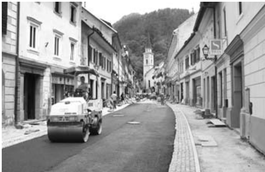
Na Trgu svobode grobi asfalt do cerkve Sv. Andreja že do sredine julija

da se s temi dosežki manipulira in da se meče slabo luč na naše pošteno in prizadevno delo! Občina Tržič bo svoje kreditne obveznosti brez težav odplačala - letošnji proračun je znašal skoraj 30 milijonov evrov. Občina ima skupnih dolgov za pretekli in ta mandat za 4,6 milijona evrov, kar je praktično nekaj več kot znašajo polletni prihodki Občine Tržič.