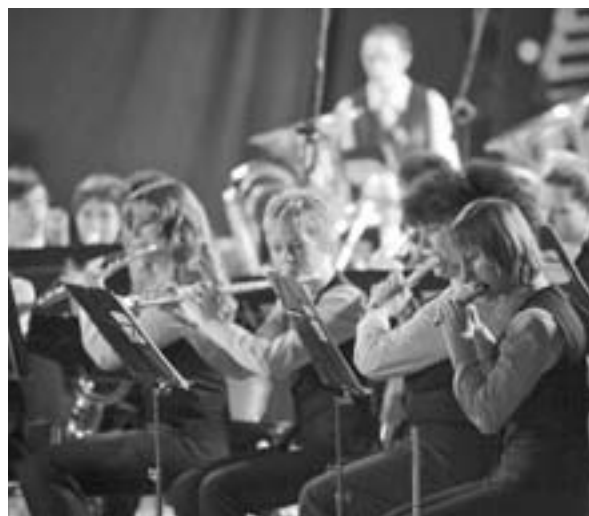
Pihalni orkester bo letos otvoril Tržiške poletne prireditve

Planinsko društvo Tržič je eno bolj številnih v občini in s svojim delom nas planinci vse spodbujajo k aktivnemu življenjskemu slogu in gibanju. Zgledno skrbijo za gorske postojanke in v primeru nesreč prek gorske reševalne službe poskrbijo za reševanje ponesrečencev. Letos bomo po-