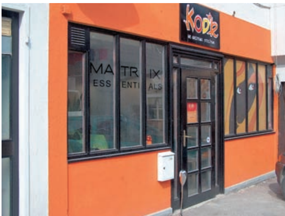
Vabljeni v salon za hipermarketom Mercator