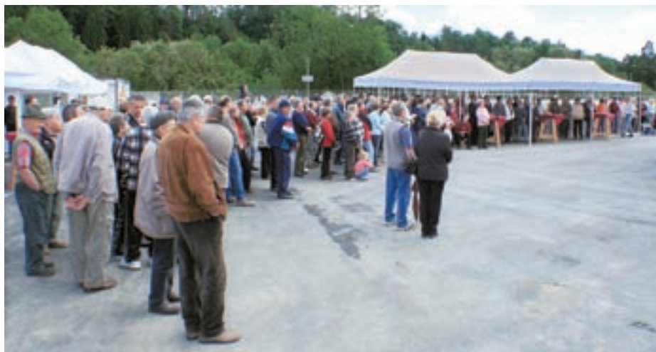
Dneva odprtih vrat se je udeležilo veliko ljudi.