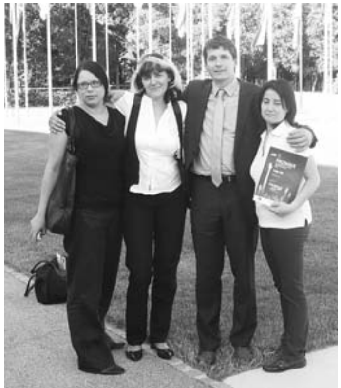
Predstavnice Centra za socialno delo Tržič z županom na Brdu