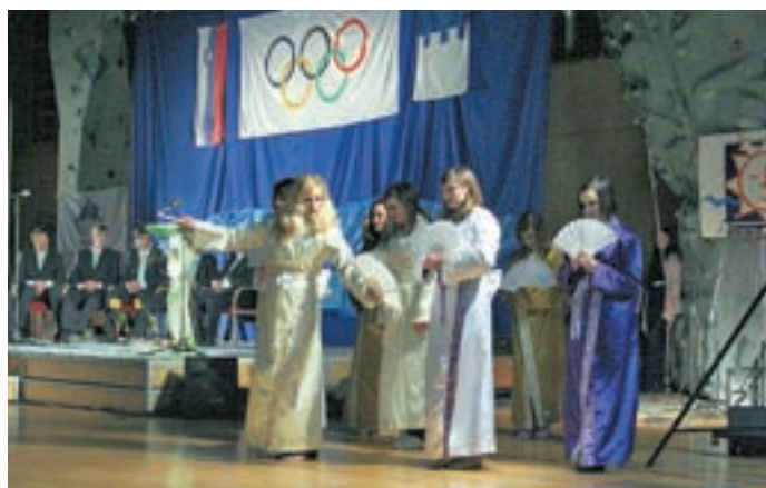
Pod olimpijskimi krogi so v Trziču nastopile plesalke Blejskega plesnega studia Trzič.