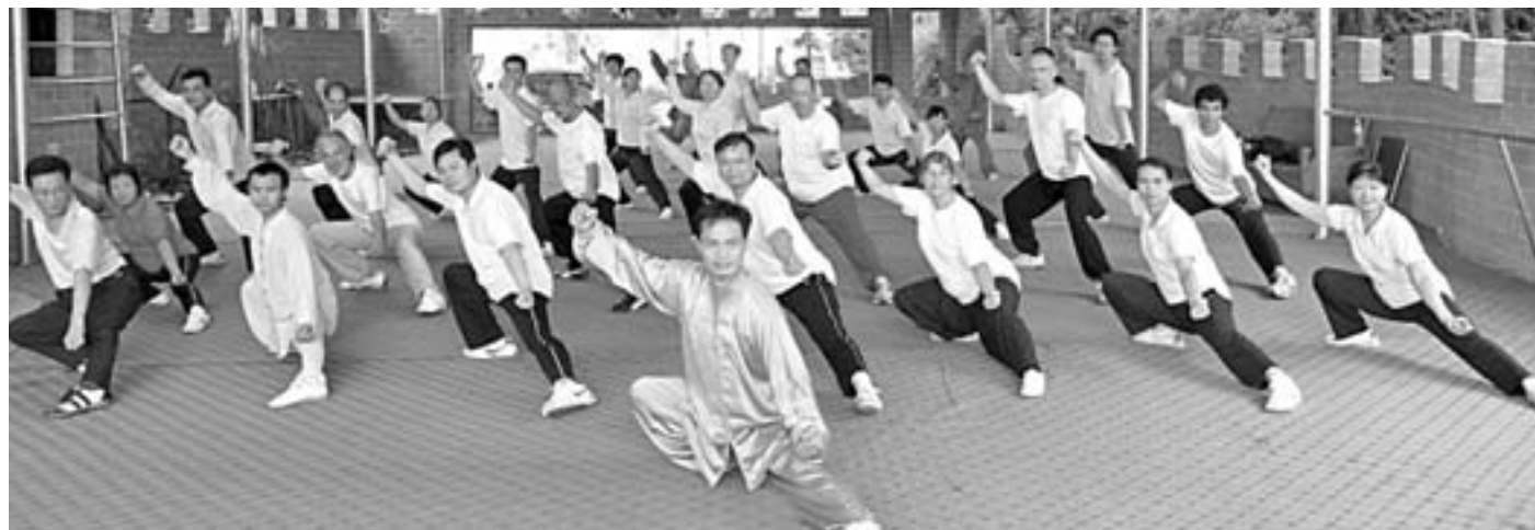
Vadba z vladnimi uslužbenci Guangzhoua

Čudovito je, če obvladujemo gibe, usklajemo in spokojno premikamo telo, potiskamo roke itd. Spoznamo, kakšna mojstrovina je naše telo, če mu poveljuje spokojen um. Taiji je veščina, s katero se učimo prav tega. Več o tajiju in društvu na www.tajizlatipetelin.si