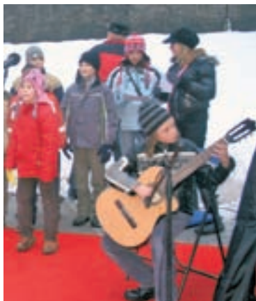
Kljub mrazu je tudi kitara lepo zazvenela.