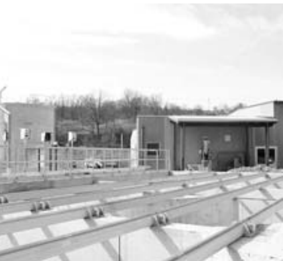
Centralna čistilna naprava predvidoma aprila v poskusno obratovanje