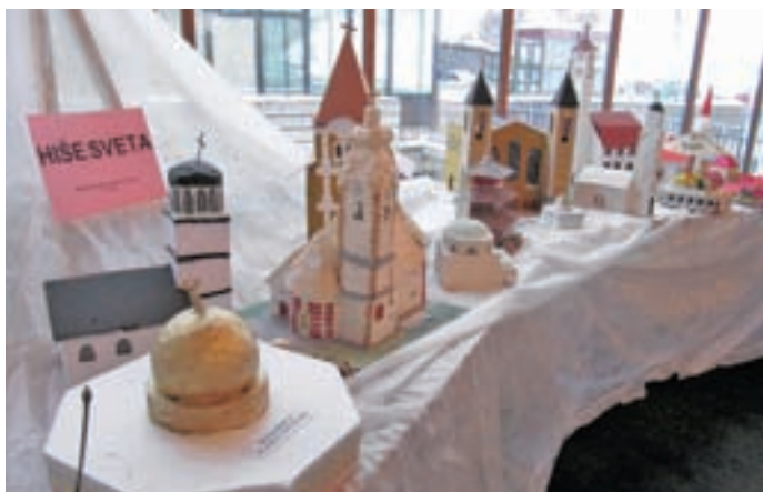
Na razstavi v Paviljonu NOB so se znašle tudi različne znane hiše sveta.