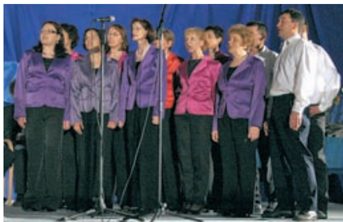
Vokalno-instrumentalna skupina Zali rovt ob spremljavi Pihalnega orkestra Trzič.