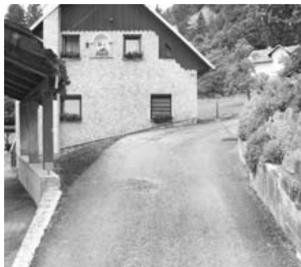
V naselju Pod gradom so dela zaključena.

ličnim izvajalcem del ter dobaviteljem pa smo bili dolžni več kot 2 milijona evrov, nekateri so na svoj denar čakali tudi po leto in pol. Danes občina do izvajalcev praktično nima neporavnanih obveznosti, kar je najpomembnejše za številne zaposlene v podjetjih, ki poslujejo z občino. In če je moj predhodnik za to, da je zgradil športno dvorano in prenovil Cankarjevo cesto (vrednost teh dveh investicij je bila cca. 6 milijonov evrov), zadolžil občino za 3,5 milijona evrov, smo mi izvedli 25 milijonov evrov vreden kohezijski projekt tako, da smo občino zadolžili za dodaten milijon evrov. Premoženje Občine pa smo z 59 milijonov evrov leta 2006 povečali na 88 milijonov evrov, kar je nedvomno rekordno premoženje občine v vsej zgodovini. Vem, da vsem ob teh podatkih ni prijetno, vendar kot župan po uspešno opravljenem mandatu nikakor ne bom dovolil,