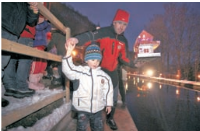
Počasi in previdno vse hiške pridejo na vrsto.