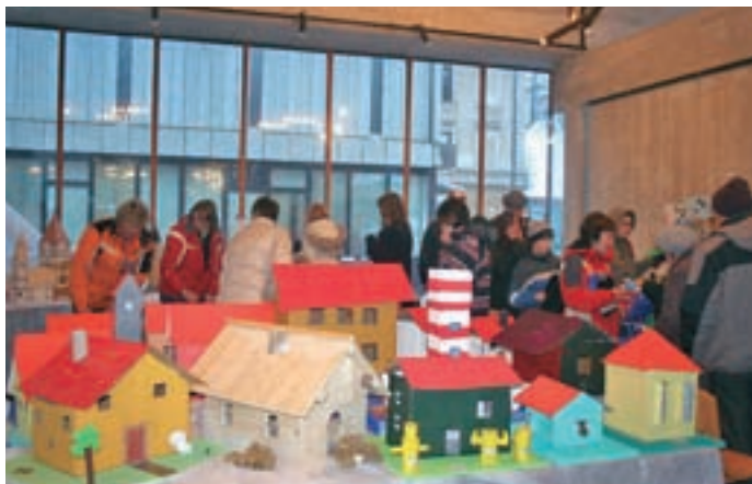
Hiške in obiskovalci na razstavi