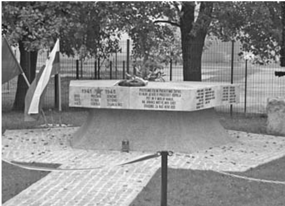
Spomenik žrtvam NOB v Križah ima novo podobo in novo lokacijo.

nost v Križah, in sicer ob odkritju obnovljenega in prestavljenega spomenika žrtvam NOB pri OŠ Križe. Spomenik NOB v Križah je obeležje in opomnik na čase,