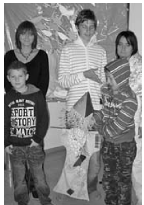
Del ekipe Mladinskega centra Tržič v pričakovanju počitniških dogodivščin

je prišel. Dan, ko smo na mladinskem centru ustvarili pravo čarovniško vzdušje. Na ustvarjalni delavnici smo iz bučk izdoblili pošasti, si pripravili čarovniški napitek, poslikali naše obraze ter se pripravili na noč čarovnic. V počitniškem času so nas v goste prijazno sprejeli tudi varovanci Varstveno delovnega centra Tržič. Na skupni delavnici so izpod naših prstov nastajale prave glinene umetnine, ki jih bomo z veseljem pokazali na razstavi. Kot spomin na poletne radosti pa smo si privoščili tudi čofotanje v bazenu. Skupaj pa se že veselimo prihodnjih, upamo, da zasneženih počitniških dni.