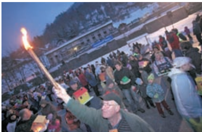
Prišel je čas, da spet vržemo "vuč v vodo".