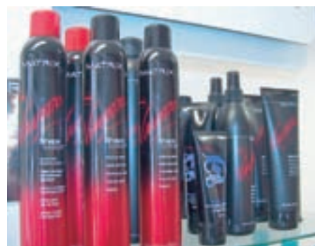
Razvijamo vas z izdelki Matrix