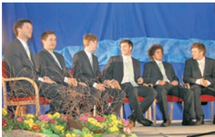
Letošnji tržiški olimpijci