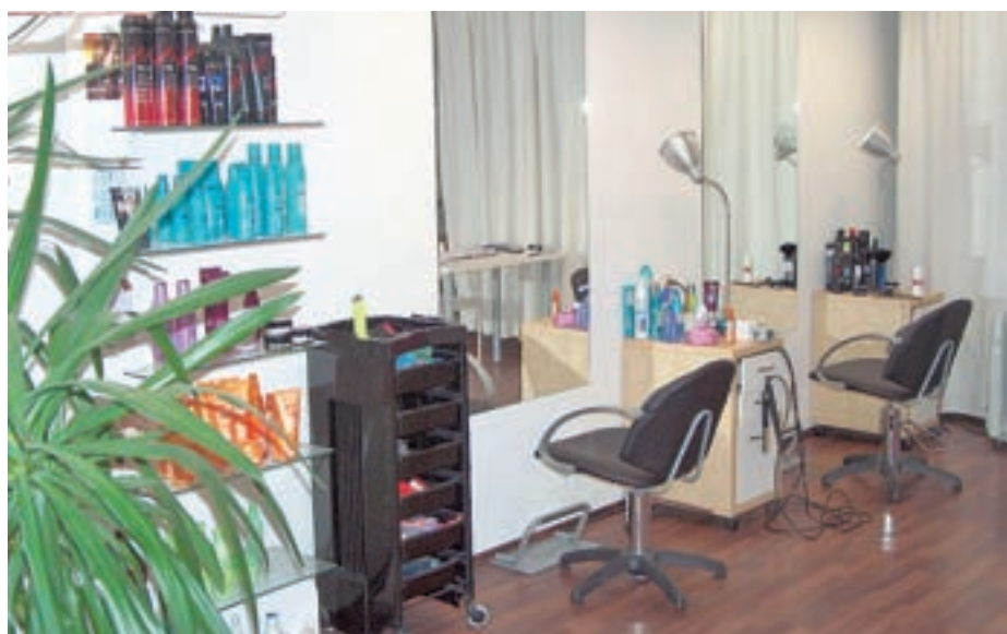
Prijeten ambient Frizerstva Kodr