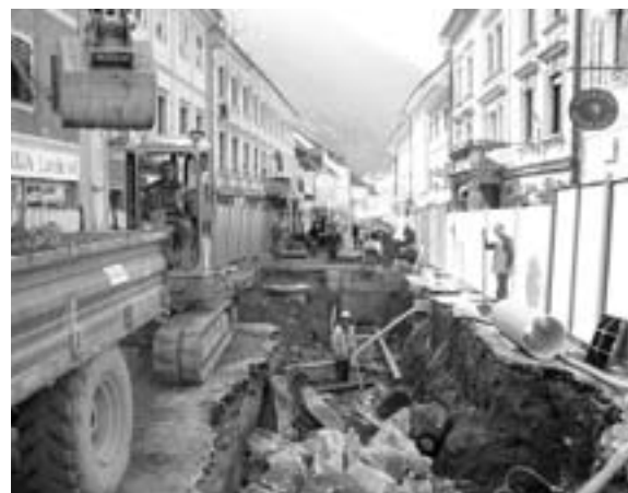
Že do jeseni bodo dela na kohezijskem projektu zaključena.

V Občini Tržič pa posebno težavo predstavljajo gradbišča na še nedokončani odsekih kohezijskega projekta. Na nekaterih odsekih cest skozi naselje Breg, Zvirče, Žiganja vas, Sebenje ter skozi glavne mestne ulice Trg svobode in Balos pred zimo ni bil položen grobi asfalt, saj dela še niso bila zaključena. Na Občini Tržič zato apeliramo na potrpežljivost in razumevanje občanov, ki živijo ob teh odsekih. Cilj Občine je, da na vseh odsekih kohezijskega projekta dela zaključimo čim hitreje. To pa pomeni, da bodo prebivalci v Žiganji vasi, na Bregu, v centru Tržiča in v Zvirčah že do jeseni pridobili povsem prenovljeno cestno, kanalizacijsko in vodovodno infrastrukturo in da bodo problemi s katerimi se soočajo v teh mesecih lahko pozabljeni za vrsto desetletij. Tudi