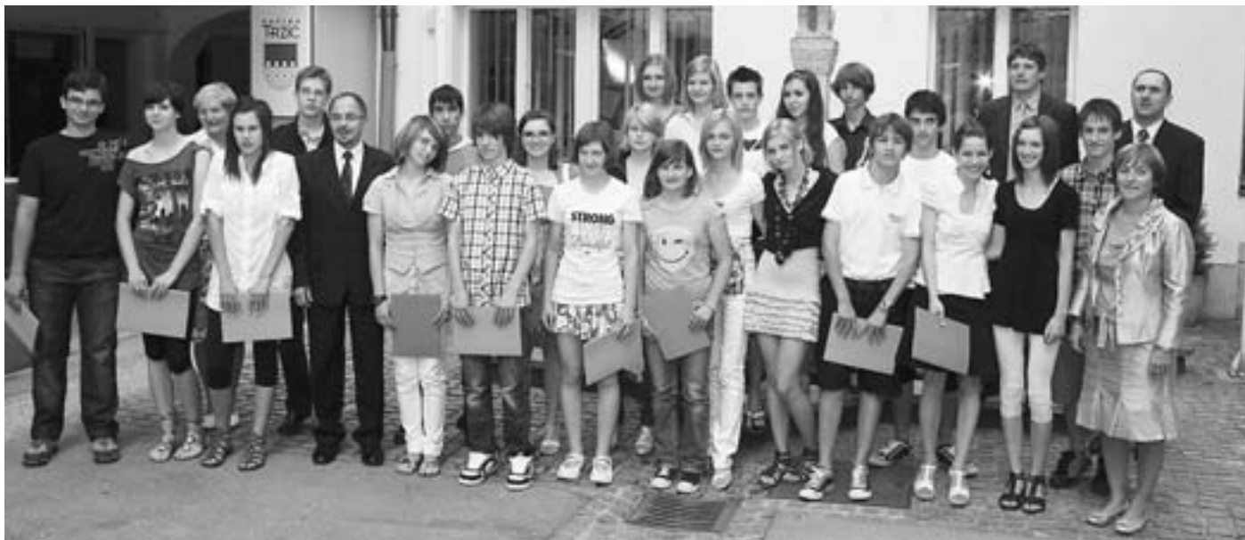
Odličnjaki iz treh osnovnih šol, njihovi ravnatelji in tržiški župan na skupni sliki v atriju Občine Tržič.