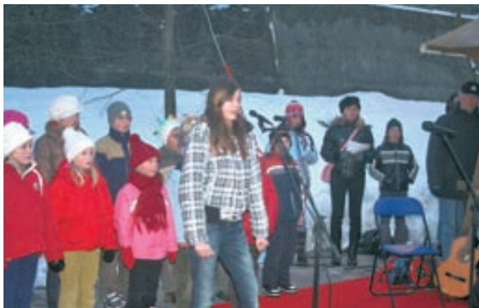
Kulturni program tržiških otrok