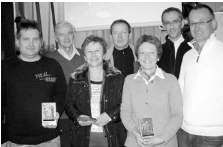
Nagrajenci društva za leto 2009