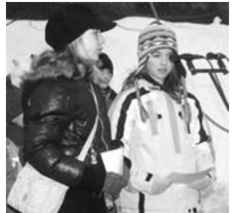
Povezovalki otroškega kulturnega programa