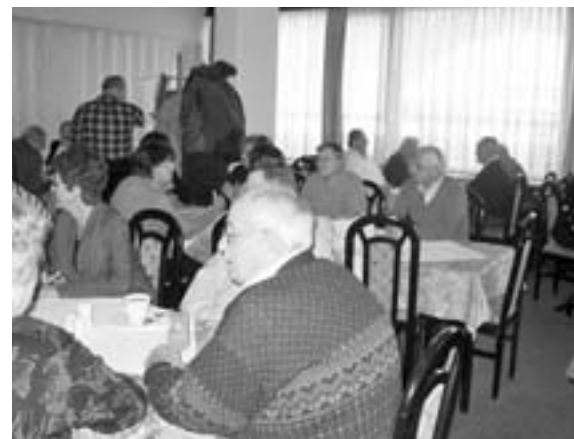
Na občnem zboru

Merčunov dan izdali tudi bilten z naslovom Stare jedi na sodoben način. Dobro je bilo poskrbljeno tudi za obveščanje članstva, saj smo izdali kar šest številk društvenega glasila Sladke novice. Okrevali smo kar dvakrat in to v Termah Rogaška in v Termah Zreče. Delo je bilo res pestro in skozi vse leto se je v društvu kaj dogajalo. Pripravljamo pa se tudi na petnajst letnico našega društva, ki bo drugo leto.