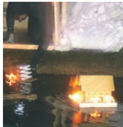
Spušcanje razsvetljenih hišk je zabavno.