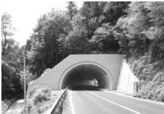
Sanacija predora končana

V začetku junija so se končala obnovitvena dela pri sanaciji predora Fužine 3 na državni cesti Bistrica pri Tržiču-Ljubelju, ki ga je Direkcija RS za ceste sanirala kot zadnjega v nizu obnove treh predorov proti Ljubelju. Izvedba sanacije je bila več kot nujna, saj so pregledi predorov pokazali precejšnje poškodbe predorske obloge (razpoke), predvsem pa je bil velik problem v vseh treh predorih neurejeno odvodnjavanje zalednih vod, kar je povzročalo zamakanje in propadanje betonske obloge predora. V slabem stanju je bilo tudi samo cestišče v predorskih ceveh. Občina Tržič z direkcijo RS za ceste dobro sodeluje in veseli smo, da je investicija končana. V preteklih dveh letih se je tako saniralo vse tri predore na državni cesti proti Ljubelju, ki so bili v resnično