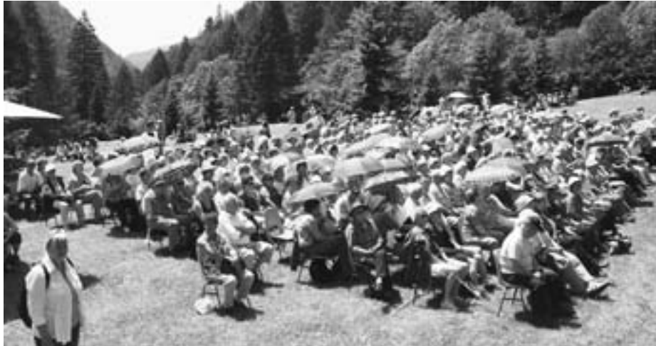
Vreme je bilo naklonjeno množici obiskovalcev v spominskem parku Mauthausen pod Ljubeljem

organizirali spominsko slovesnost ob 65-letnici osvoboditve podružnice koncentracijskega taborišča Mauthausen pod