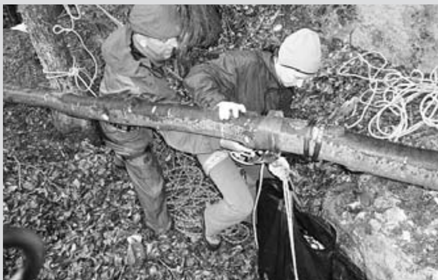
Še en utrinek s čistilne akcije AO Trzin v Dovžanovi soteski