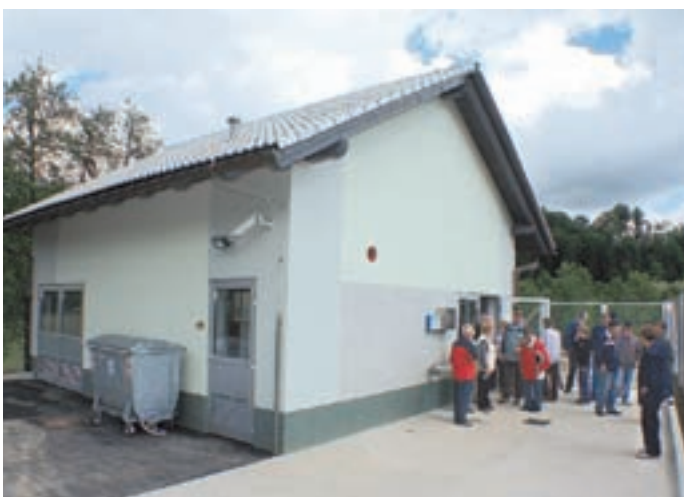
Vhodno črpališče na CČN