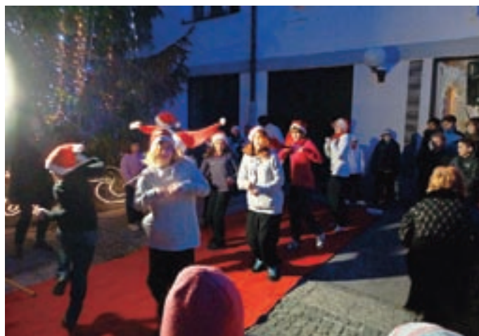
Poskočni plesni ritmi PK Tržič