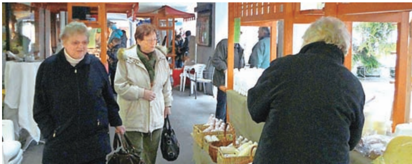
Dober obisk in pestra ponudba na božičnem sejmu