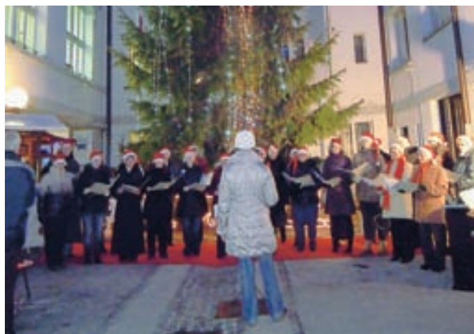
Dupljanke so ogrele srca poslušalcev.