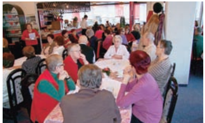
Na občnem zboru