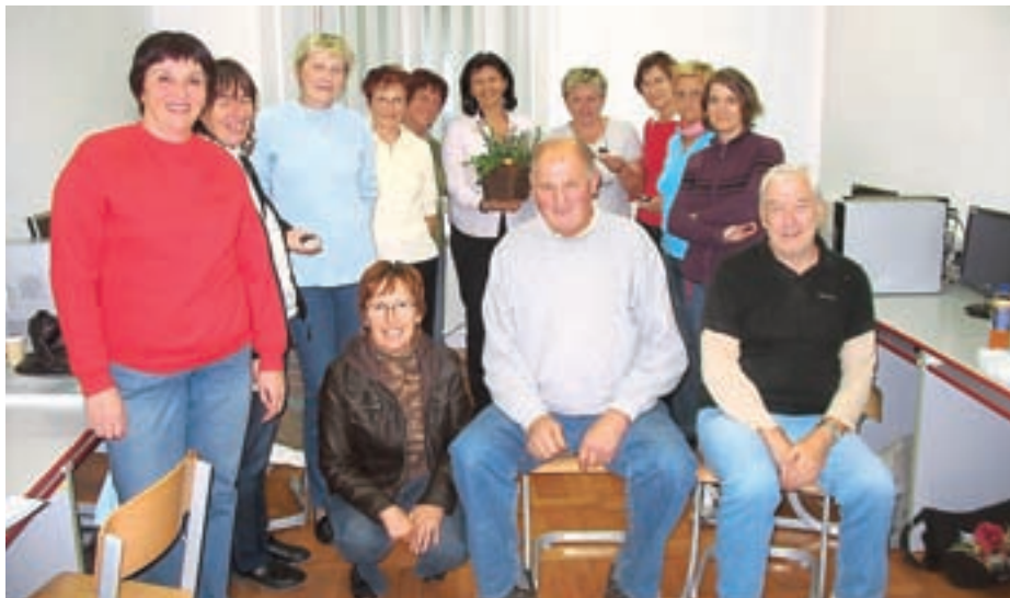
Skupina uspešnih tečajnikov računalništva

Na Ljudski univerzi Tržič februarja začnemo z novimi izobraževalnimi programi, ki bodo zaradi izjemno uspešnega kandidiranja na razpisu Ministrstva za šolstvo in šport v celoti financirani iz sredstev Evropskega socialnega sklada. Prijave za vse programe, ki bodo za udeležence v celoti brezplačni, bomo zbirali do 6. februarja 2012 . Vsebine, ki jih bomo v