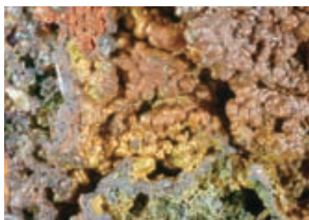
Goethit Sit natečena struktura

Štirideset udeležencev različnih poklicev je zadovoljnih zapuščalo kotno dvorano Prirodoslovnega muzeja Slovenije v Ljubljani. Prihodnje leto so na vrsti zopet fosili.