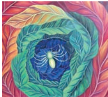
V učilnici 3 na Ljudski univerzi Tržič se s samostojno razstavo predstavlja priznani tržiški slikar Vinko Hlebš. Vabljeni na ogled.

tednom vseživljenjskega učenja, in sicer 9. maja v Knjižnici dr. Toneta Pretnarja, kjer bo ob 19. uri predstavitev bralnega krožka, ki deluje na Ljudski univerzi Tržič. 14. maja bomo predstavili Zglede dejavnega staranja in se pogovarjali o Spremembah razmišljanja ter izvedli prvo Srečanje študijske skupine. 15. in 16. maja bomo odprli vrata Slikarske delavnice za vse udeležence ter pripravili Osvežitvene urice računalništva. 15. maja se bomo soočali z izdelavo Spletne učilnice, dan pozneje bodo na sporedu Legende iz Irske. 18. maja bomo odkrivali nova andragoška spoznanja na področju vseživljenjskosti učenja, se 22. maja odpravili na strokovno učno ekskurzijo in 23. maja v sodelovanju z Domom Petra Uzarja in Varstveno delovnim centrom Tržič odprli slikarsko razstavo.