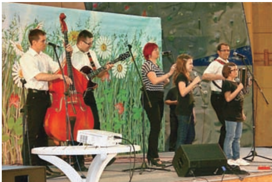
Ansambel Zarja sta spremljali mladi pevki, obe učenki POŠ Lom pod Storžičem.