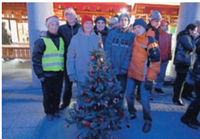
Ekipa tržiškega VDC je jelko okrasila z okraski iz lecta.

koklub, D-Bartol, d. o. o., Koper, Trgovina Romi - Sašo Rožič s.p., Pošta Slovenije - PE Kranj, Pivovarna Union, Planinsko društvo Tržič, Alpetour potovalna agencija, d. d., Komunala Tržič, d. o. o., Slovenski etnografski muzej Ljubljana, Prešernovo gledališče Kranj, Tehniški muzej Slovenije, Spar, d. d, Slovenska vojska ter Pomorski in tehniški izobraževalni center Portorož v sodelovanju z Akvarijem Piran.