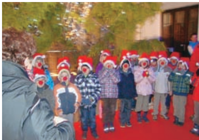
Prisrčen pevski nastop Sončkov iz kriške enote Vrtca Tržič