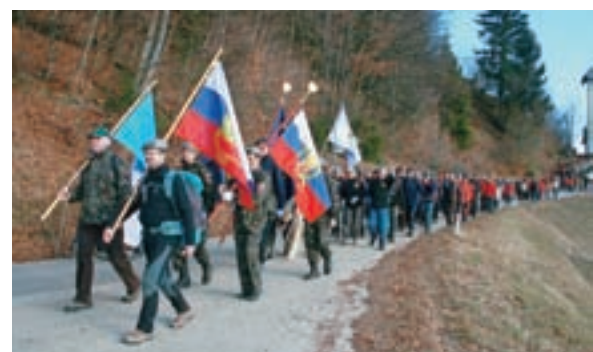
Pohod od cerkvice sv. Jedrt proti Dražgošam