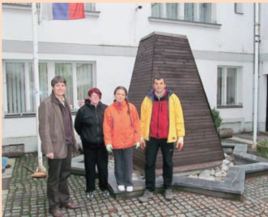
Člani Medobčinskega društva gluhih in naglušnih Auris, ki sodelujejo v programu Asistent/asistentka bom, so prostovoljno opravili čiščenje občinskega atrija. Za samoiniciativnost ter pripravljenost se jim zahvaljujem.