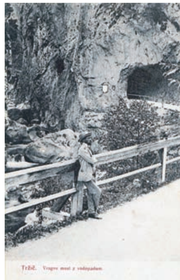
Lavš, Leopold, Vragov most z vodopadom. Tržič, dopisnica. TRŽ; FO-0001237

V maju torej v muzejske prostore, prav tako pa na razstavo v Kurnikovi hiši lepo vabimo vse, ki vas zanima preteklost našega kraja. Najprej mlade - otroke iz vrtcev in osnovnih šol in družine, za katere smo pripravili nagradno igro Muzejski detektiv. Ob učnih listih bodo otroci poiskali znamenitosti v starem mestnem jedru in ob obisku muzeja dobili v dar nagrado. V naše prostore pa ste toplo vabljeni seveda tudi vsi odrasli ljubitelji zgodovine, etnologije in naravne dediščine.