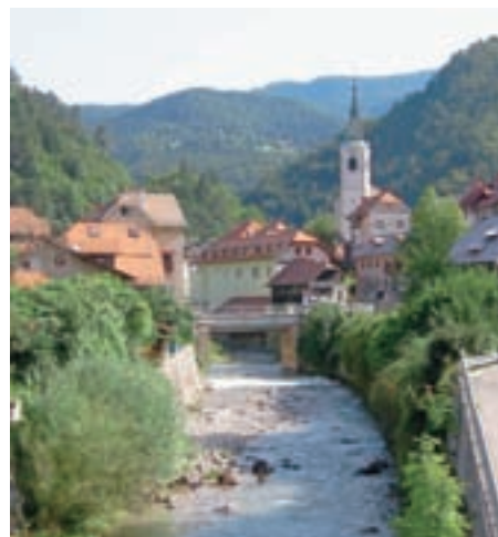
Kulturni center Tržič ob Tržiški Bistrici

V sredo, 4. aprila, je na Občini Tržič prvič potekal skupni podpis pogodb s tržiskimi društvi. Srečanje smo izkoristili za pogovor o stanju v tržiški ljubiteljski kulturi, izzivih, s katerimi se kulturniki srečujejo,