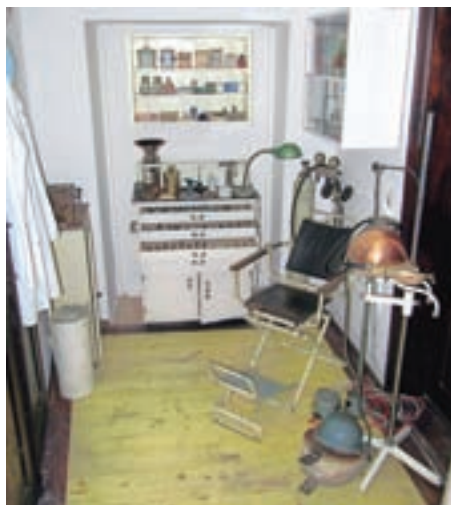
Pogled v novo zobozdravstveno zbirko