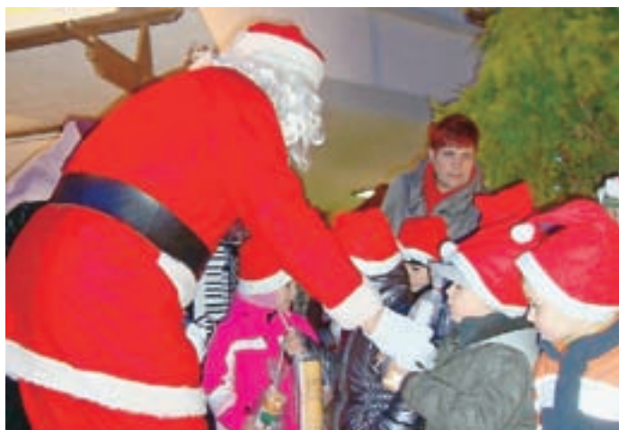
Božiček je delil darila.