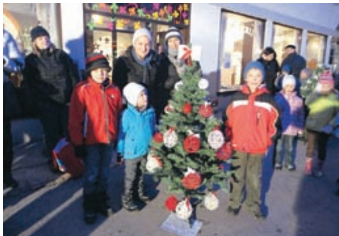
Podljubeljski osnovnošolci in mladi iz Mladinskega centra - CSD Tržič so ponosni na svoji Naj jelki 2011.